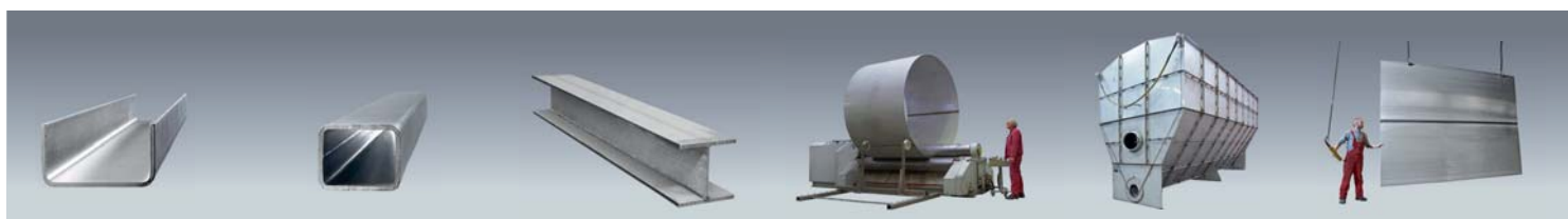
Kantprofile Bent profiles